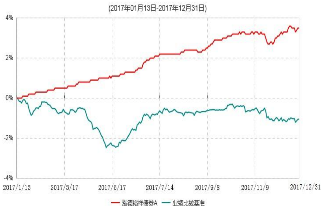
泓德裕祥债券A累计净值增长率与业绩比较基准收益率历史走势对比图