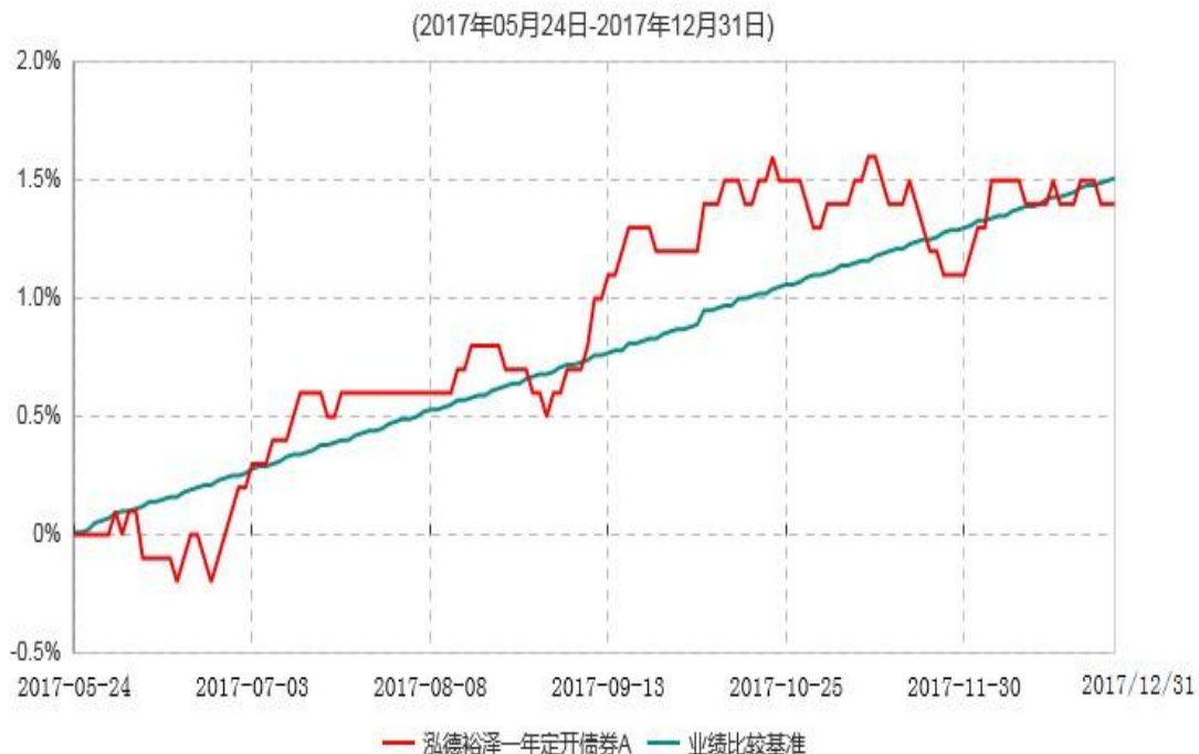
泓德裕泽一年定开债券A累计净值增长率与业绩比较基准收益率历史走势对比图