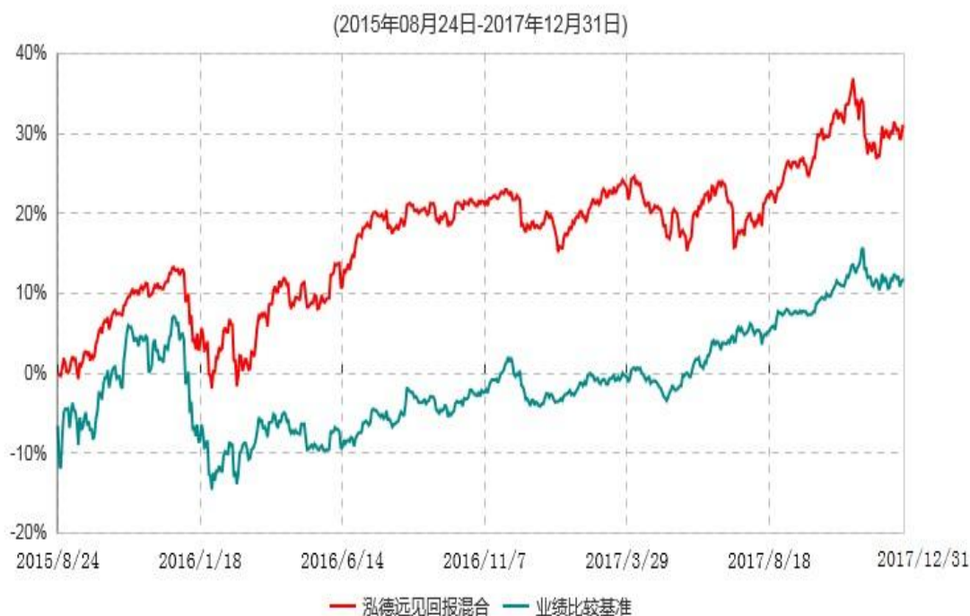
泓德远见回报混合型证券投资基金累计净值增长率与业绩比较基准收益率历史走势对比图

注：根据基金合同的约定，本基金建仓期为6个月，截至报告日，本基金的各项投资比例符合基金合同关于投资范围及投资限制规定。