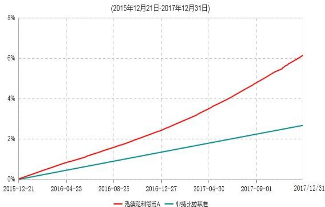
泓德泓利货币A累计净值收益率与业绩比较基准收益率历史走势对比图