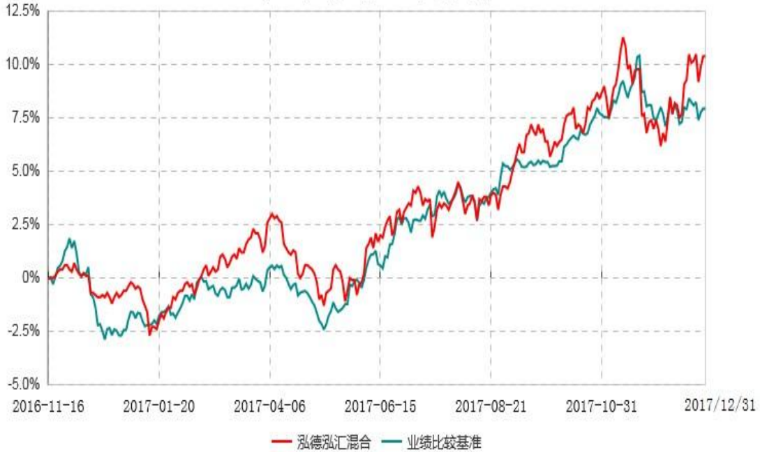
泓德泓汇灵活配置混合型证券投资基金累计净值增长率与业绩比较基准收益率历史走势对比图 (2016年11月16日-2017年12月31日)

注：根据基金合同的约定，本基金建仓期为6个月，截至报告日，本基金的各项投资比例符合基金合同关于投资范围及投资限制规定。