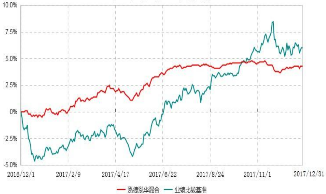
泓德泓华灵活配置混合型证券投资基金累计净值增长率与业绩比较基准收益率历史走势对比图 (2016年12月01日-2017年12月31日)

注：根据基金合同的约定，本基金建仓期为6个月，截止报告日，本基金的各项投资比例符合基金合同关于投资范围及投资限制规定。