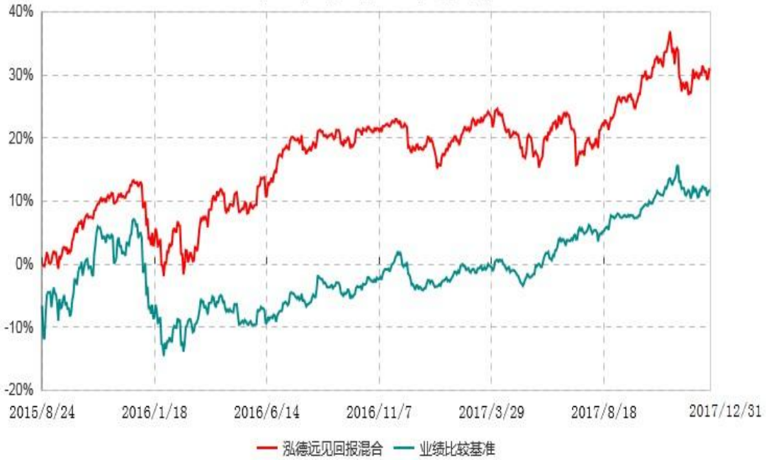
泓德远见回报混合型证券投资基金累计净值增长率与业绩比较基准收益率历史走势对比图 (2015年08月24日-2017年12月31日)

注：根据基金合同的约定，本基金建仓期为6个月，截至报告日，本基金的各项投资比例符合基金合同关于投资范围及投资限制规定。