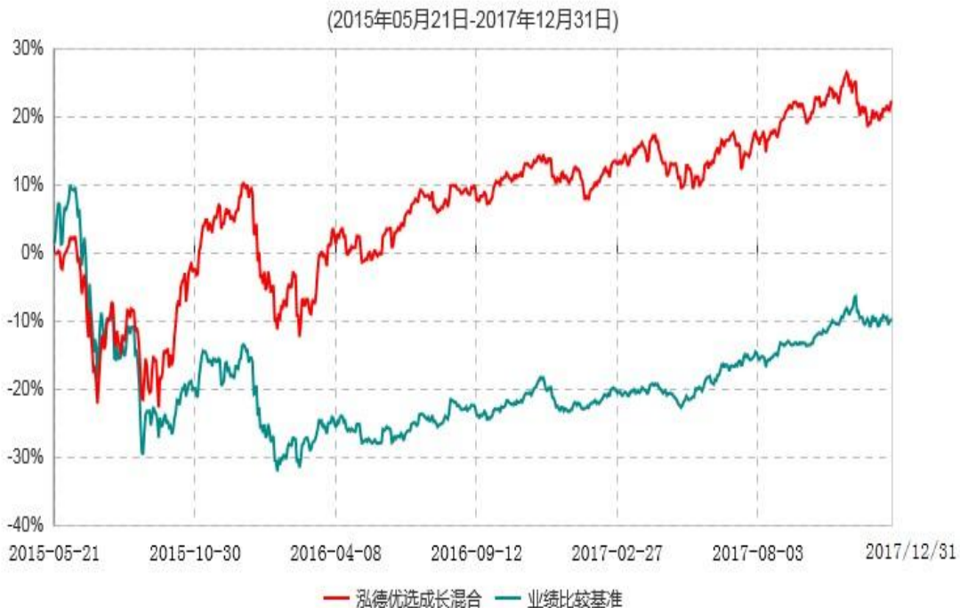
泓德优选成长混合型证券投资基金累计净值增长率与业绩比较基准收益率历史走势对比图

注：根据基金合同的约定，本基金建仓期为6个月，截至报告日，本基金的各项投资比例符合基金合同关于投资范围及投资限制规定。