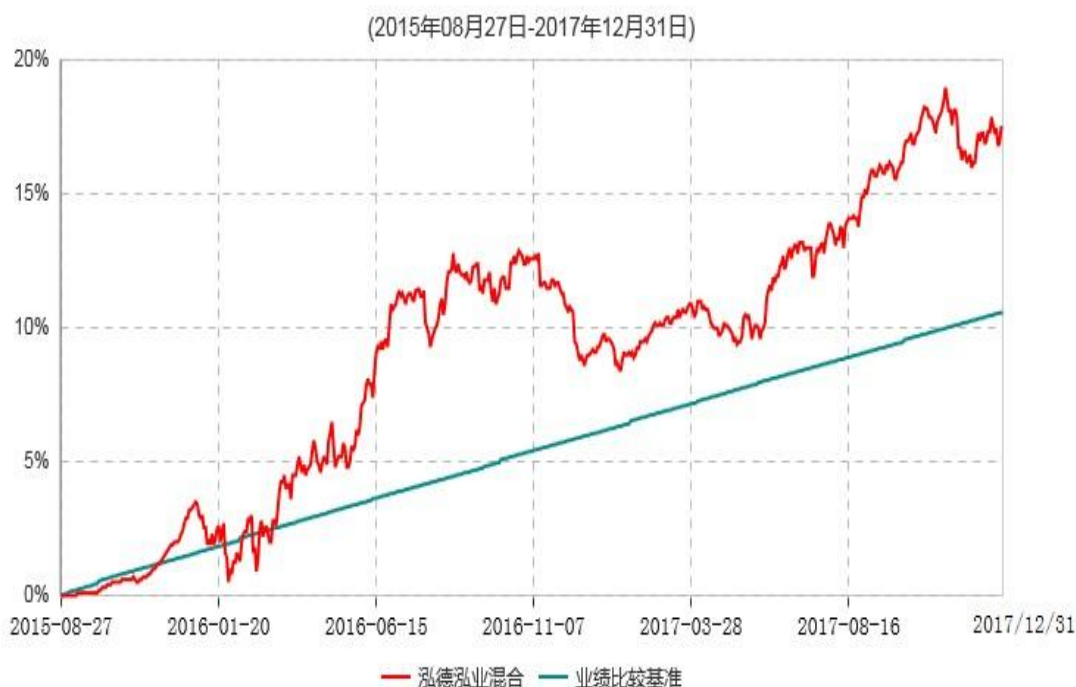
泓德泓业灵活配置混合型证券投资基金累计净值增长率与业绩比较基准收益率历史走势对比图

注：根据基金合同的约定，本基金建仓期为6个月，截至报告日，本基金的各项投资比例符合基金合同关于投资范围及投资限制规定。