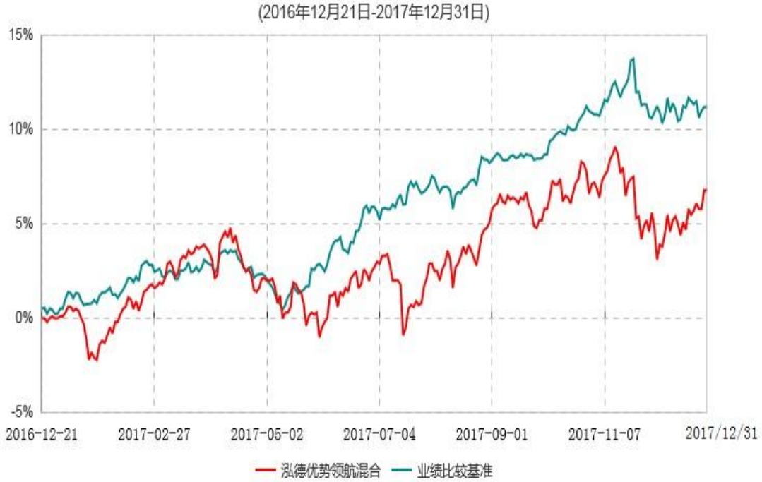
泓德优势领航灵活配置混合型证券投资基金累计净值增长率与业绩比较基准收益率历史走势对比图

注：根据基金合同的约定，本基金建仓期为6个月，截止报告日，本基金的各项投资比例符合基金合同关于投资范围及投资限制规定。