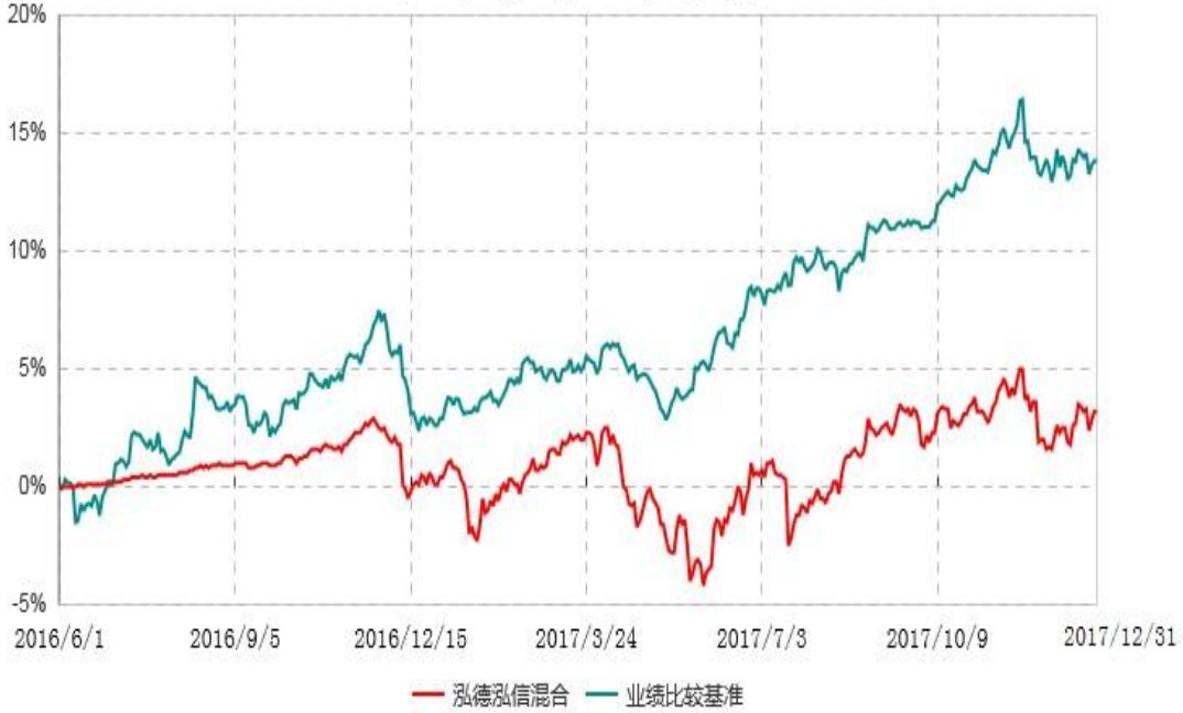
泓德泓信灵活配置混合型证券投资基金累计净值增长率与业绩比较基准收益率历史走势对比图 (2016年06月01日-2017年12月31日)

注：根据基金合同的约定，本基金建仓期为6个月，截止报告日，本基金的各项投资比例符合基金合同关于投资范围及投资限制规定。