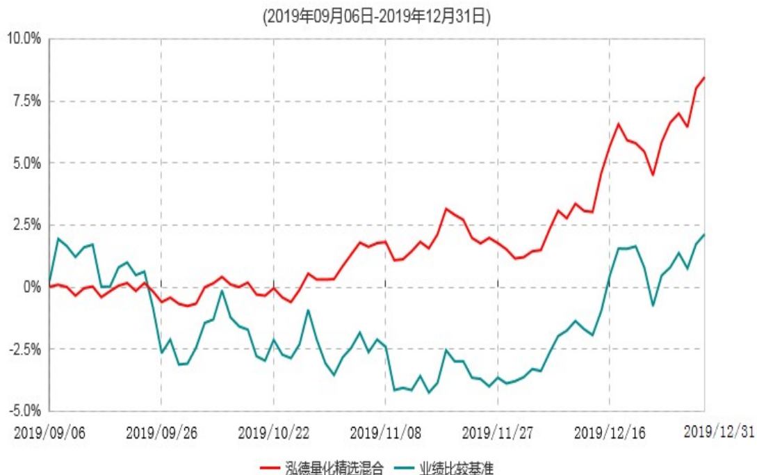
泓德量化精选混合型证券投资基金累计净值增长率与业绩比较基准收益率历史走势对比图