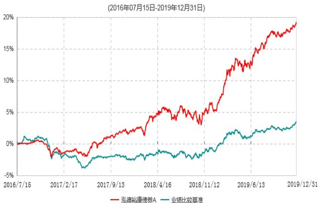
泓德裕康债券A累计净值增长率与业绩比较基准收益率历史走势对比图