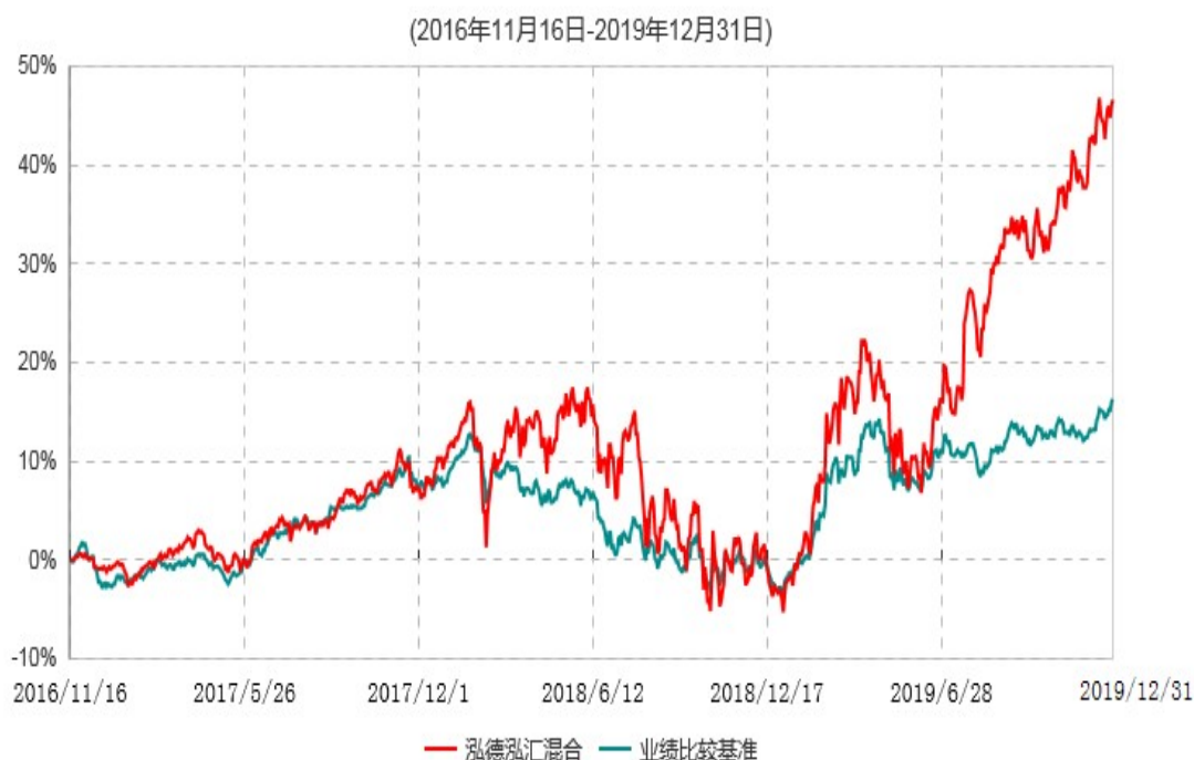
泓德泓汇灵活配置混合型证券投资基金累计净值增长率与业绩比较基准收益率历史走势对比图

注：根据基金合同的约定，本基金建仓期为6个月，截至报告期末，本基金的各项投资比例符合基金合同关于投资范围及投资限制规定。