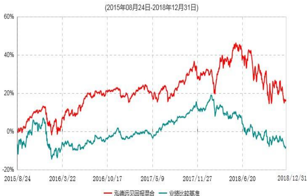
泓德远见回报混合型证券投资基金累计净值增长率与业绩比较基准收益率历史走势对比图

注：根据基金合同的约定，本基金建仓期为6个月，截至报告期末，本基金的各项投资比例符合基金合同关于投资范围及投资限制规定。